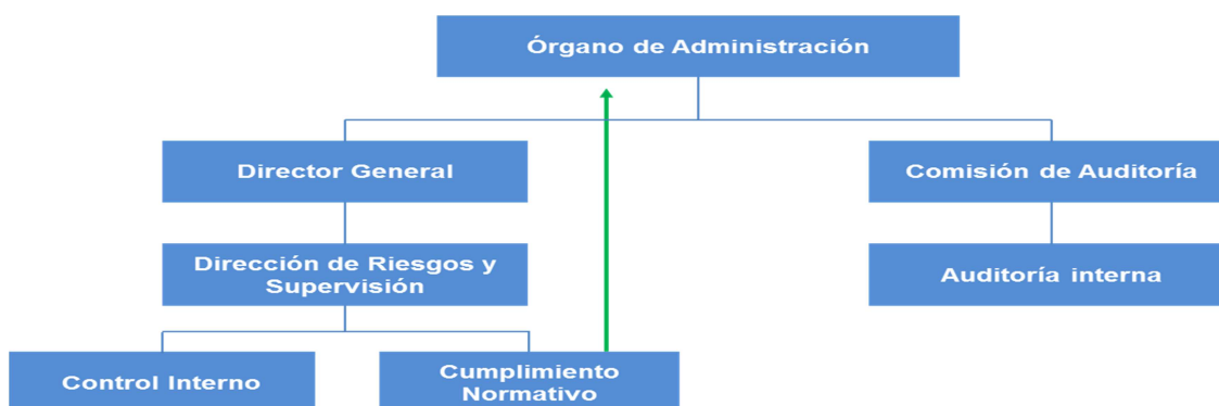
Gráfico 2:

Un ejemplo de su ubicación dentro del organigrama podría ser el siguiente: