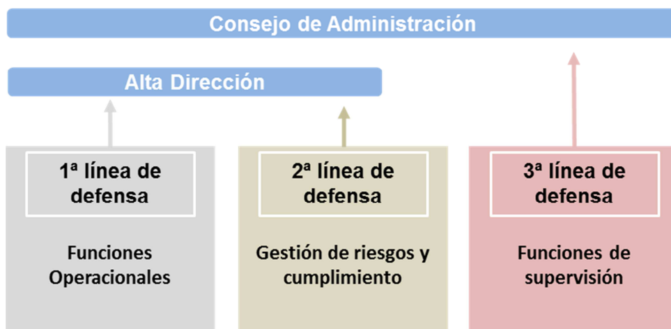
Gráfico 3: Fuente adaptación de gráfico de "The Institute of Internal Auditors".

A continuación se muestra un gráfico donde se muestran las 3 líneas de negocio y su dependencia jerárquica.