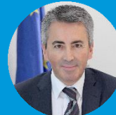
Sergio Álvarez Director General DIRECCIÓN GENERAL DE SEGUROS Y FONDOS DE PENSIONES